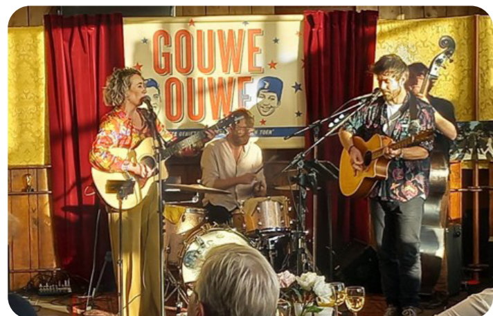
WelzijnWonenPlus organiseert met regelmaat activiteiten met muziek in de hoofdrol. Houd de activiteitenkalender in de gaten!